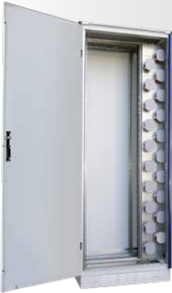
| Gabinete con zócalo