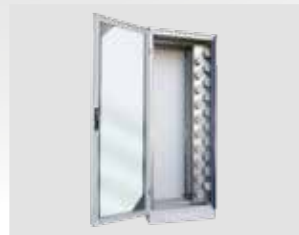
| Puerta frontal opcional de vidrio